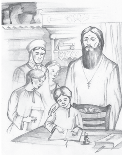
Рис. Л.А. Вороновой

Эти слова во многом носят автобиографический характер и показывают, как под мудрым руководством отца и нежной, любовной попечительностью матери, при благочестивой настроенности всего семейства протекали детские годы святителя.