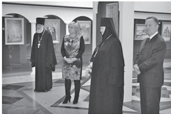
Церемония открытия выставки

В течение 2015 года выставка будет работать в различных муниципальных образованиях Рязанской области, выставку ждут в Скопине, Касимове, Сасове и других городах области. Многие люди смогут увидеть небесную красоту этой обители, где поневоле вспоминаются слова самого святителя, который писал: «Выша стоит, и ворота отворены. Когда ни благословит Господь посетить ее для богомолья, всегда найдете ее готовую принять вас — утешить и освежить».