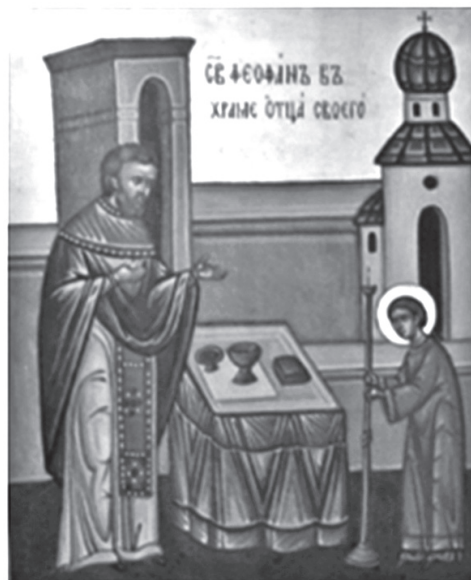
Клеймо житийной иконы свт. Феофана

От матери Георгий унаследовал нежное, любящее сердце, доброту и впечатлительность, а также черты внешнего облика. От отца же святитель Феофан унаследовал сильный и глубокий ум. Отец-священник часто брал с собой сына в храм Божий, где тот становился на клирос или прислуживал в алтаре.