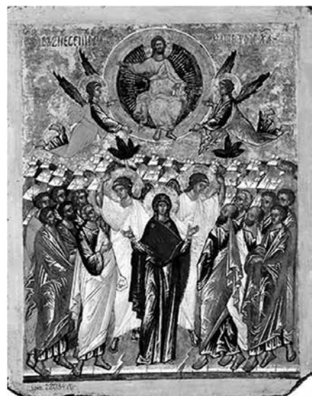
Вознесение Господне. Конец XV в. Двухсторонняя икона-«таблетка» из Софийского собора в Новгороде. Государственная Третьяковская галерея

Многочисленные иконы Вознесения имеют единую композицию. Богородица в центре, два ангела, указывающие на небо, и двенадцать учеников славят Христа, изображаемого в голубой славе, которую поддерживают ангелы. Поза и жесты Богородицы различаются. Чаще всего Богородица представлена фронтально, с молитвенно воздетыми или согнутыми у груди руками, ладонями к зрителю.