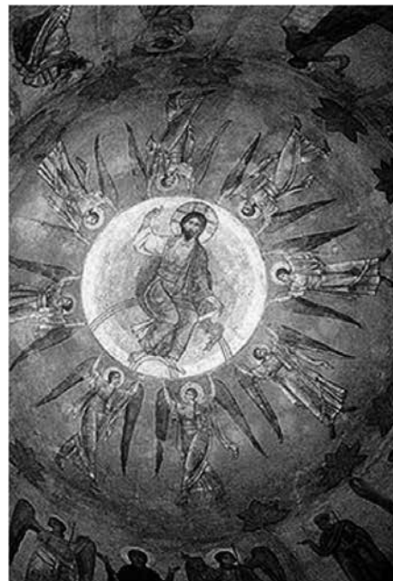
Вознесение Господне. Середина XI в. Фреска Спасо-Преображенского собора Мирожского монастыря в Пскове

В монументальной живописи Вознесение уже в раннехристианскую эпоху располагалось в своде купола наряду с сошествием Святого Духа и образом Христа Пантократора. В медальоне – образ возносящегося Господа, вокруг которого подобно спицам колеса, располагались ангелы. Их сложные позы создавали впечатление ритмичного движения, почти танца.