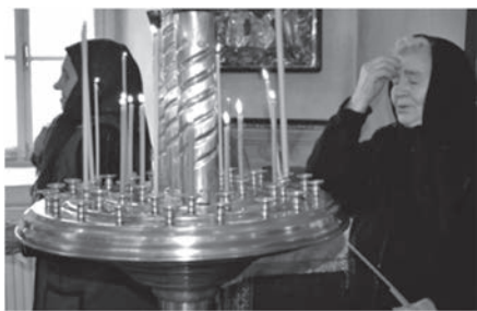
В храме монастыря

Святая Православная Церковь постепенно готовит верующих к Великому посту. В храме звучат особые Евангельские чтения и песнопения, которые подготавливают душу и сердце к дням покаяния и плача о своих грехах.